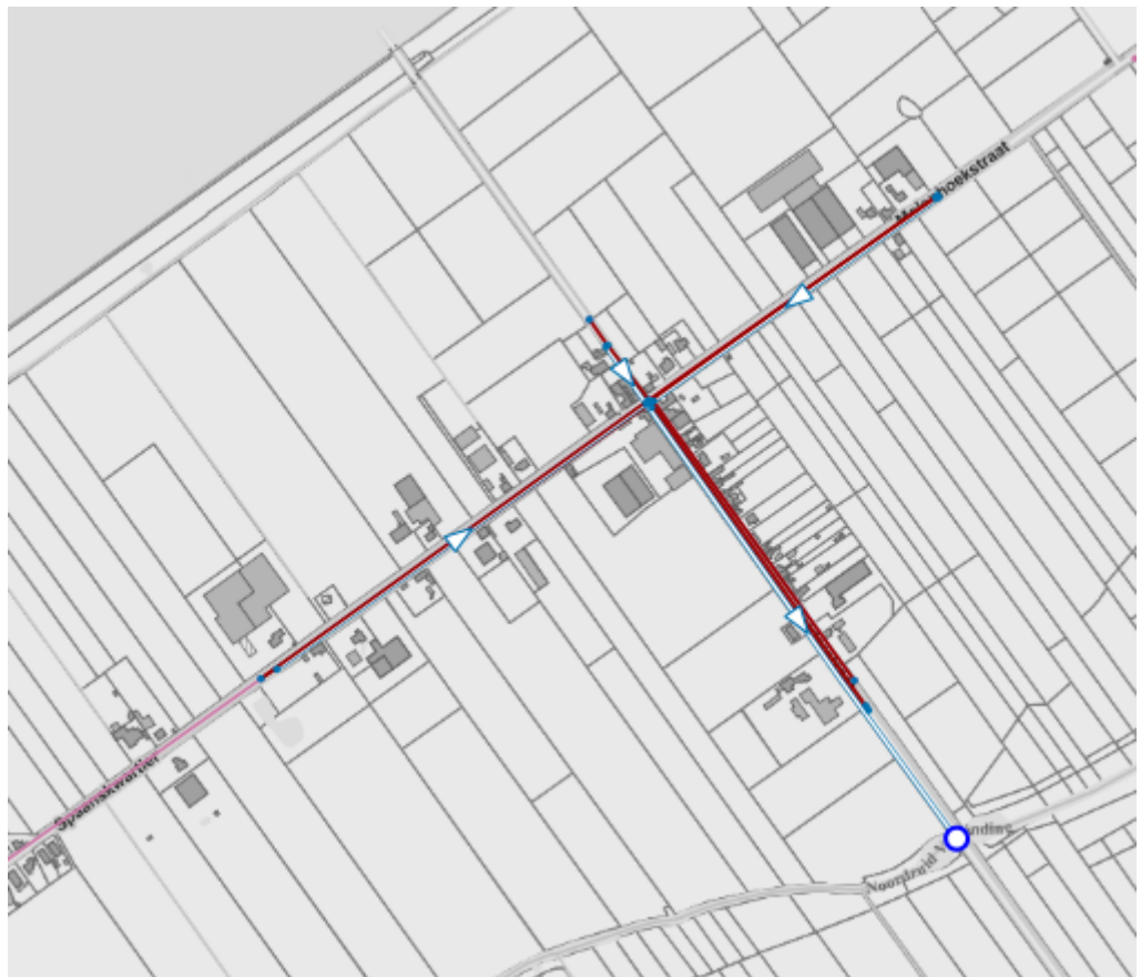
Aanduiding rioleringsproject (aansluiting Polderstraat – Molenhoekstraat)

De gemiddelde doorlooptijd van een dergelijk rioleringsproject bedraagt 7 jaar. In functie van de te doorlopen procedures zal de uitvoering ten vroegste in 2026 starten.