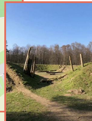
Speelbos 't Kalf