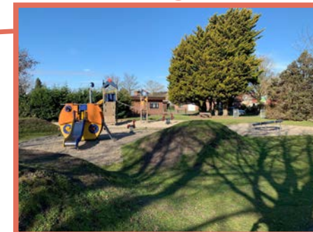
Beweegbank aan Sporthal Molenberg