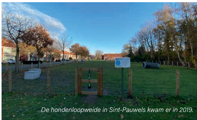
De hondenloopweide in Sint-Pauwels kwam er in 2019.

Onze geliefde viervoeters lopen graag vrij rond. Niet enkel thuis maar ook buiten op het openbaar domein. De komende jaren zorgt de gemeente ervoor dat in elke deelgemeente iedere hond op een hondenloopweide vrij kan rondlopen onder toezicht van zijn of haar baasje. In Sint-Pauwels legden we al zo'n weide aan. Meerdonk en De Klinge volgen om daarna de bestaande weide in Sint-Gillis-Waas te vernieuwen. De gemeente voorziet hiervoor 50.000 euro.