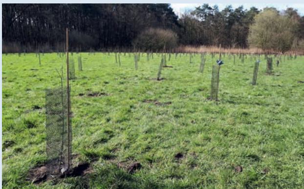
De jaarlijkse aanplanting van het geboortebos blijft bestaan.

De gemeente streeft ernaar om in de komende zes jaar jaarlijks 20% meer bomen te planten dan nu.