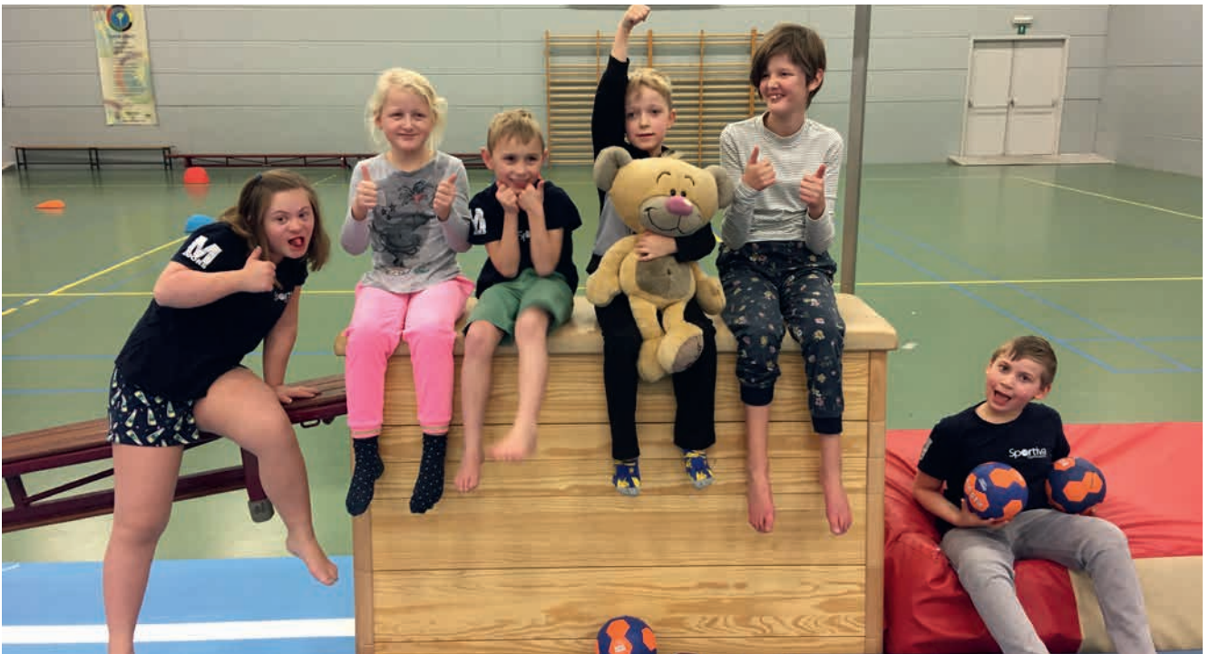
De gymnasten van de G-gym samen met de mascotte van de groep, knuffelbeer Gymbolie.