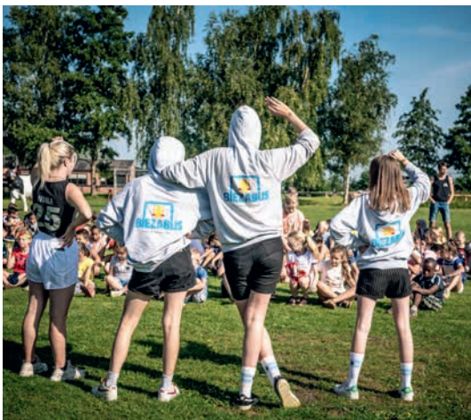
Speelplein Biezabijs blies in 2019 maar liefst 25 kaarsjes uit!

Jeugdverenigingen kunnen tegen een kleine vergoeding het jeugdhuis voor een weekend afhuren om een fuif of andere activiteit te organiseren. De gemeentelijke jeugddienst geeft advies over hoe je een fuif organiseert en er is ook een subsidie voor wie fuifbuddies in wil zetten.