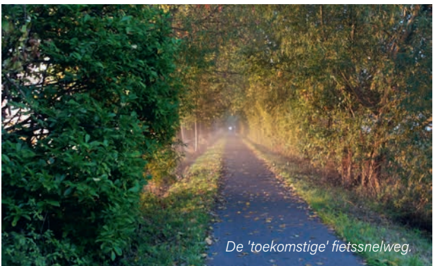
De 'toekomstige' fietssnelweg.

De gemeente zet in op het verbreden van de fietsverbinding Hulst-Sint-Niklaas. De fietsroute over de oude spoorwegbedding wordt ingericht als een fietssnelweg.