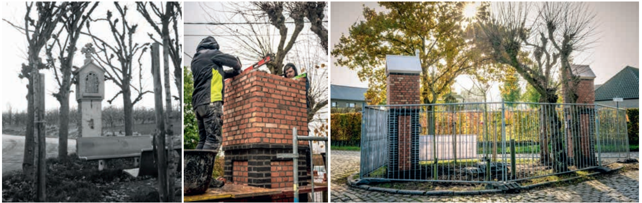
Twistkapelletjes vroeger, tijdens en na de werken.

Aan het einde van de Grouwesteenstraat vind je twee kapelletjes: één kapel voor Sint-Pauwels en één voor Kemzeke.