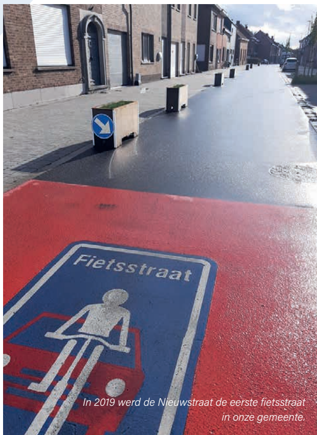
In 2019 werd de Nieuwstraat de eerste fietsstraat in onze gemeente.

Om het fietsverkeer op korte afstanden in de gemeente te stimuleren, plant de gemeente tal van fietsvriendelijke maatregelen. We onderzoeken de mogelijkheid om nieuwe verbindingen aan te leggen. We voorzien 400.000 euro.