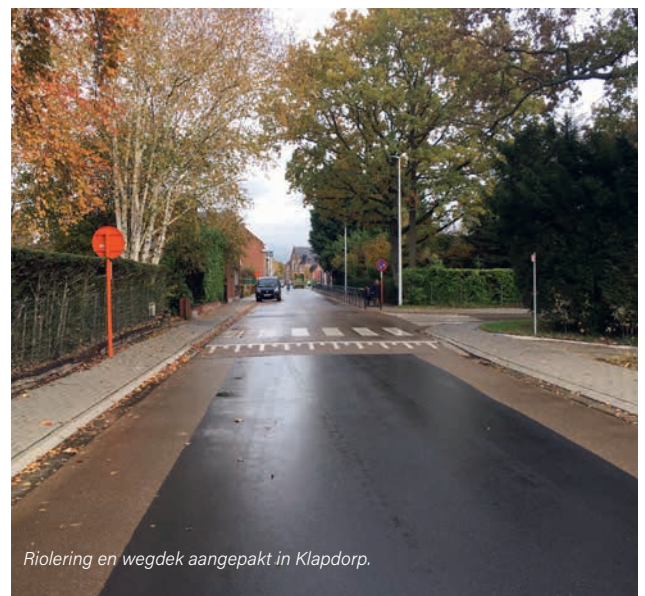
Riolering en wegdek aangepakt in Klapdorp.

Met de aanleg van een nieuwe woonwijk 't Broek achter het woonzorgcentrum De Kroon wordt de Broekstraat tussen de Reepstraat en de Broekpolderstraat verbreed.