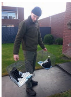
Stijn van RATO vzw aan het werk tijdens een vangactie.

De gevangen zwerfkatten worden door een dierenarts gesteriliseerd/gecastreerd en daarna opnieuw uitgezet.