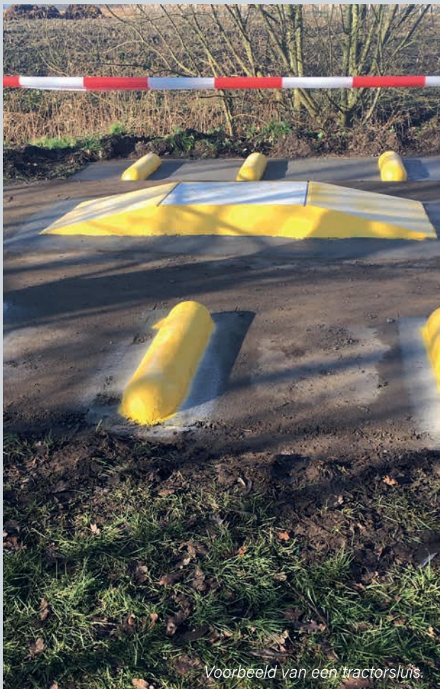
Voorbeeld van een tractorsluis.

MEER INFO? Wegen en Water, 03 727 17 00, wegen.water@sint-gillis-waas.be