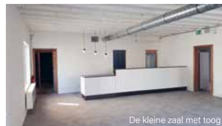
De kleine zaal met toog