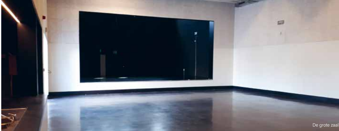
De grote zaal