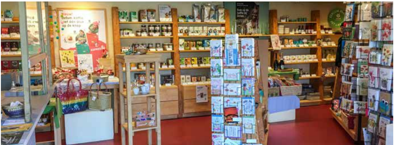
De wereldwinkel in onze gemeente

In het gemeentelijk infoblad van maart-april las je dat onze gemeente de uitdaging van de provincie Oost-Vlaanderen niet uit de weg gaat en gedurende één jaar 10 mondiale uitdagingen wil realiseren. Fairtrade is een belangrijk element van die 10 mondiale uitdagingen. Onze gemeente draagt Fairtrade een warm hart toe. Sinds oktober 2011 zijn we een FairTradeGemeente.