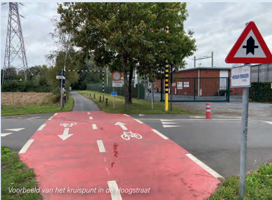
Voorbeeld van het kruispunt in de Hoogstraat

De kruispunten van de F411 met de Geinsteindestraat, Shondstraat, Klokputweg, Heerweg, Aststraat en Stationstraat worden heraangelegd om de fietsers voorrang te geven op het verkeer dat de fietssnelweg kruist.