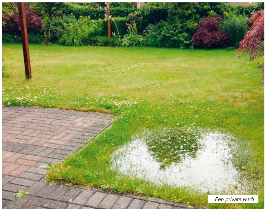
Een private wadi