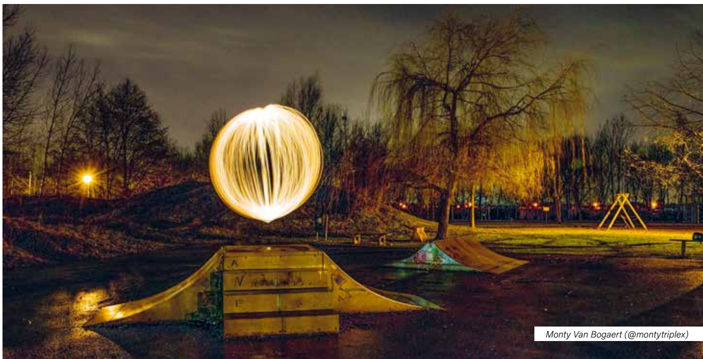
Monty Van Bogaert (@montytripleX)

Wij zoeken foto's van onze inwoners! Heb je een foto van een geslaagde activiteit, leuke plek of mooi sfeerbeeld? Bezorg deze foto dan – samen met wat info - aan Communicatie via communicatie@sint-gillis-waas.be en wie weet, verschijnt je foto in een volgende 'in beeld! Bedankt!