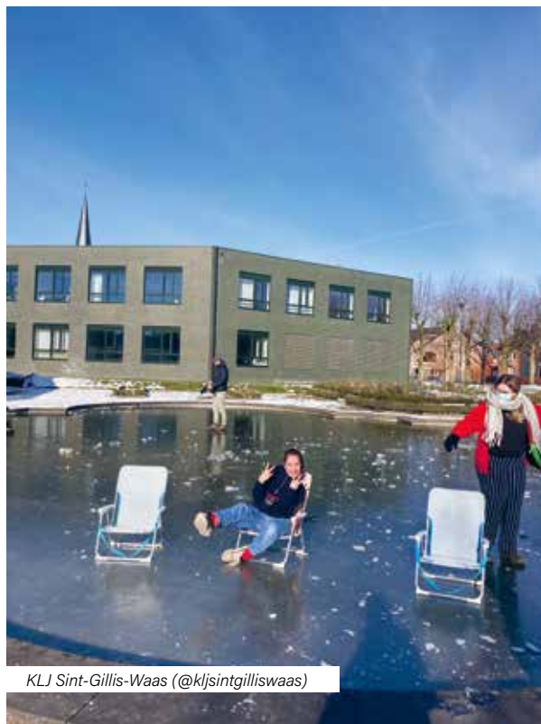
KLJ Sint-Gillis-Waas (@kljsintgilliswaas)