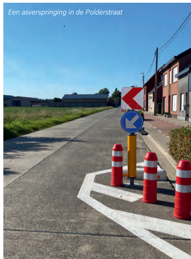
Een asverspringing in de Polderstraat

Om het verkeer in de Polderstraat af te remmen, plaatste de gemeente een proefopstelling met versmallingen en een asverspringing.