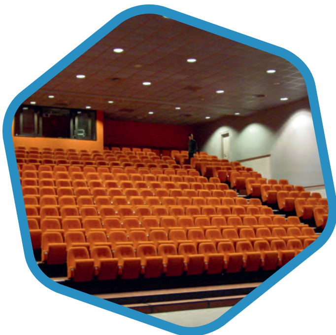
De tribune van GC De Route

De gemeente wil minimaal 7 gemotoriseerde trekken installeren, met de mogelijkheid om uit te breiden naar 12 stuks. Dat maakt niet alleen het bekabelen en verhangen van lichtarmaturen op normale hoogte mogelijk, maar het maakt van de zaal in GC De Route een moderne, rendabele theaterzaal. Het biedt zoveel meer mogelijkheden qua decor, doeken, wanden, geluid, projectie en vooral de mogelijkheid om dit alles binnen kortere termijn volledig om te keren, op een veilige en werkbare manier. Daarnaast moet de installatie van een loopbrug inclusief zaaltrek het richten, verhangen en bekabelen van spots boven de tribune mogelijk maken.