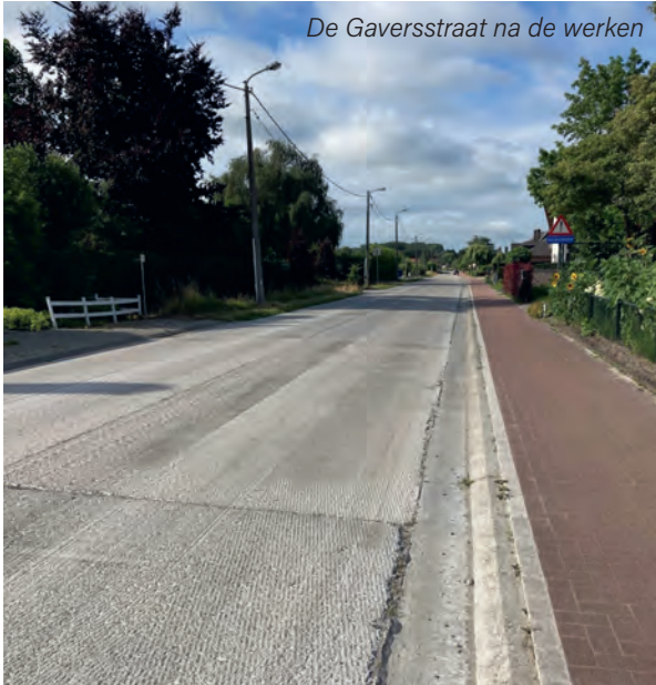
De Gaversstraat na de werken

De oneffenheden in de Gaversstraat zijn weg. De betonplaten werden er fijngefreed.