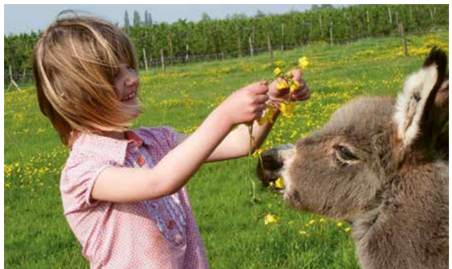
Beleefboerderij De Holdamhoeve kreeg steun van #Een hart voor Waas.

Ook een project uit onze gemeente kon rekenen op de steun van het streekfonds: het project van beleefboerderij Holdamhoeve.