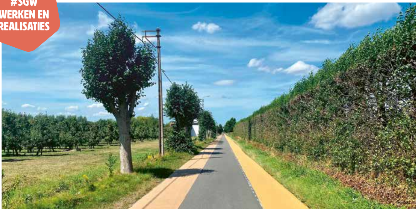
De fietssuggestiestroken in de Holdamstraat.