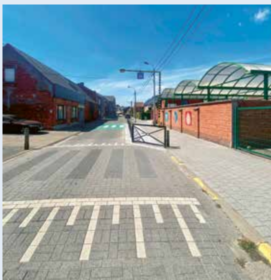
De aangepakte schoolomgeving van De Wegwijzer.

Als tweede realisatie in het dossier 'veilige schoolomgevingen' pakten we de schoolomgevingen in Meerdonk aan. Opnieuw gaf Vlaanderen zijn akkoord over de subsidiering (50 % van de uitgaven - max. 25.000 euro per schoolomgeving). Zo gingen de projecten schoolomgeving GOM en schoolomgeving De Wegwijzer van start.