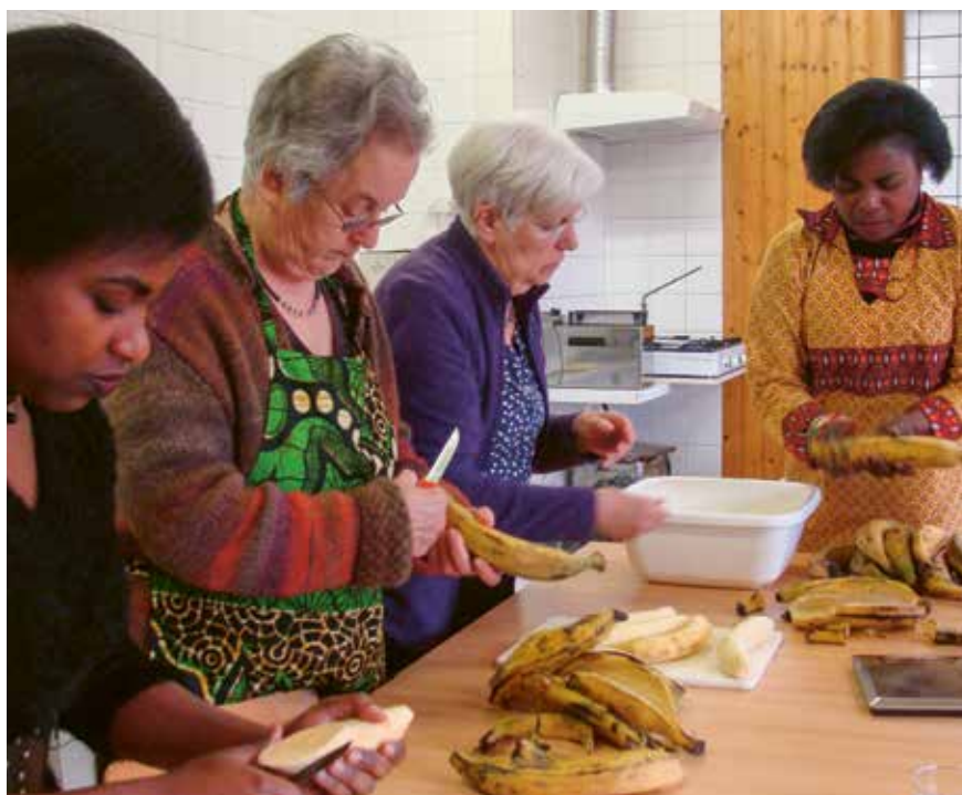
Vrijwilligers maken een solidariteitsmaal klaar.

De eenvoudige hulpverlening van het Sint-Egidiusfonds kan mensen gelukkiger maken. Zij voelen aan dat ze er niet alleen voor staan. Getuigenissen in scholen en verenigingen tonen aan dat velen niet weten dat er bij ons 'stille armoede' bestaat waarvoor iets kan gebeuren. Het Sint-Egidiusfonds probeert op die manier een steen te verleggen en meer warmte in onze samenleving te brengen.