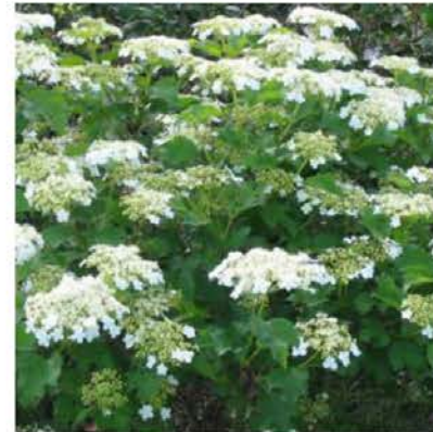
Viburnum opulus gelderse roos