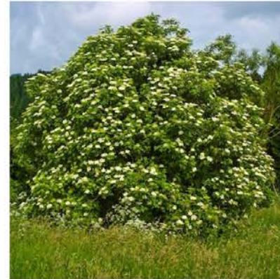
Sambucus nigra gewone vlier