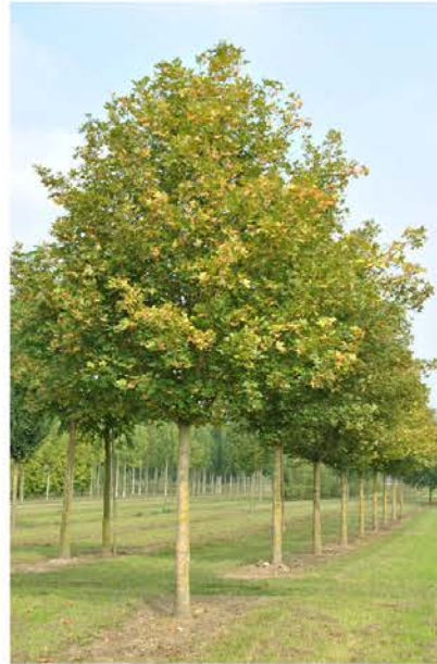
Acer campestre veldesdoorn