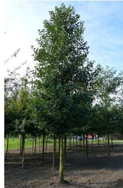
Alnus glutinosa zwarte els