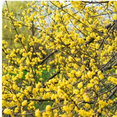
Cornus mas gele kornoelje