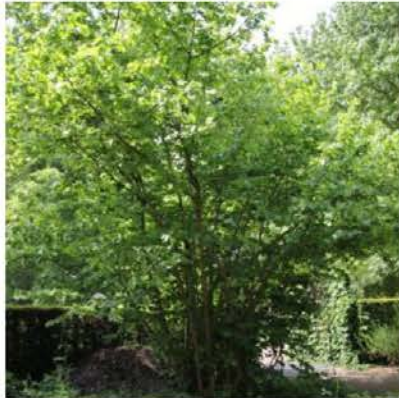
Corylus avellana hazelaar