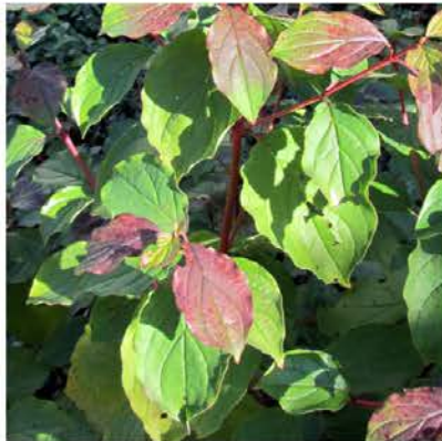
Cornus sanguinea rode kornoelje