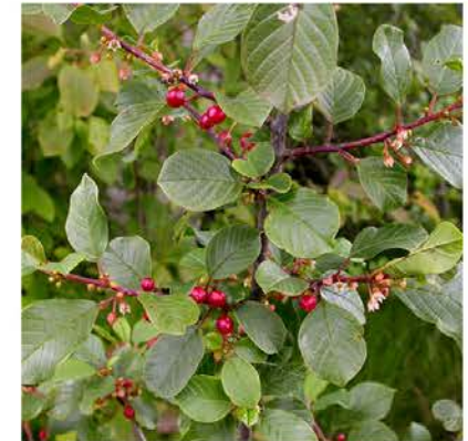
Rhamnus frangula sporkehout