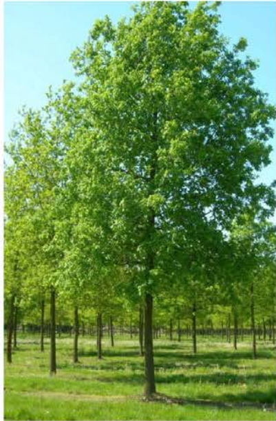
Quercus robur zomereik