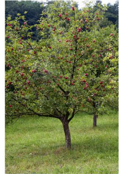
fruitbomen (lokale soorten)