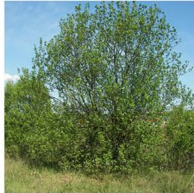
Salix caprea boswilg