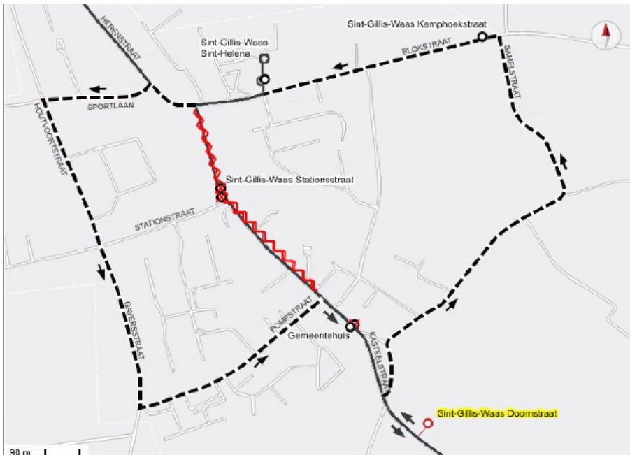
Omleidingskaart De Lijn